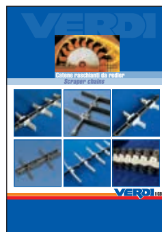
Catalogo Catene Raschianti