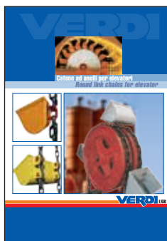
Catalogo Catene per Elevatori