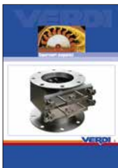
Catalogo Separatori Magnetici