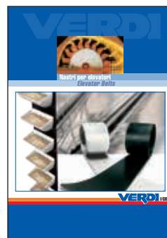
Catalogo Nastri per elevatori