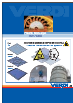
Catalogo Pannelli Antiscoppio